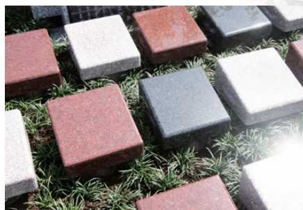
整然とした個別区画

故人様のお名前を個別に残せるため、誰が眠る場所かが分かりやすく、家族が安心して手を合わせられます。