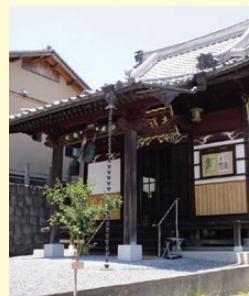
寺宝 聖観音菩薩（観音堂内） 足利市重要文化財