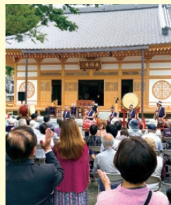
あじさい弁天まつり