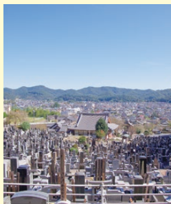
足利市内を一望できます

弘長年間（1261～1263）源姓足利氏五代の頼氏が、覚恵和尚を開山として創建したと伝えられ、頼氏の供養塔が残されています。本堂から山へとつづく坂道は、頼氏が幕府へ出仕する際に自身の栄進を祈願して登ったとの言い伝えも残されています。現在は「あじさい寺」とも呼ばれ、あじさいの最盛期には「あじさい弁天まつり」が盛大に行われています。