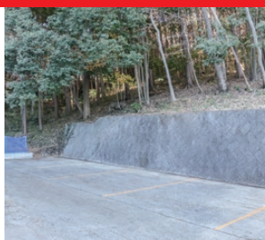
樹木葬横駐車場 墓域まで車いすでお参り可能